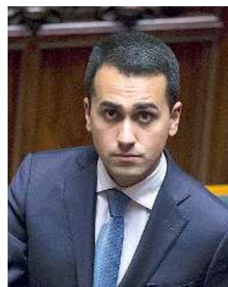
L'ospite. L'on. Luigi Di Maio, vicepresidente della Camera

Da oggi alla Cascina Maggia. Domenica l'intervento dell'on. Luigi Di Maio