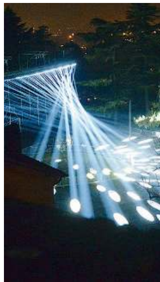
Effetti. Luci d'argento

Come arrivare. In occasione di CidneOn, via Avogadro e via del Castello saranno chiuse dalle 17.30 di oggi: sarà possibile raggiungere la sommità del colle Cidneo con il bus navetta gratuito, attivo dalle 17.30 all'una (oggi invece partirà alle 20) con corse ogni dieci minuti circa. Le navette collegheranno via del Castello (fermata nei pressi della stazione metro San Faustino) a via Langher e piazzale Arnaldo.