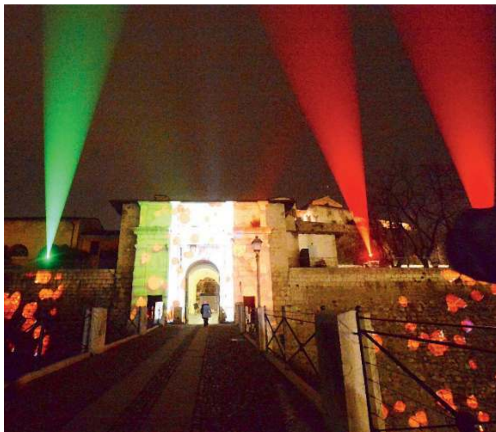
Verso il cielo. Fari puntati in direzione delle stelle per colorare il cielo di Brescia