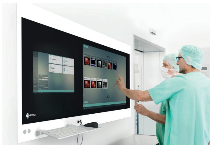
LE IMMAGINI IN ALTISSIMA QUALITÀ PERMETTONO UNA DIAGNOSI PRECISA

EIZO ITALIA VIA TORINO, 3-5, 20814 VAREDO (MB) TEL. 0362 1695250 EIZOITMED@EIZO.COM WWW.EIZO.IT