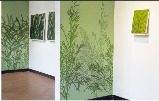
Veduta Orders di Francesco Ciavaglioli, Museo Diocesano di Brescia.

MAGAZINE ARTE FOTOGRAFIA EXTRA FOCUS NEWSBOX SHOP POPULAR