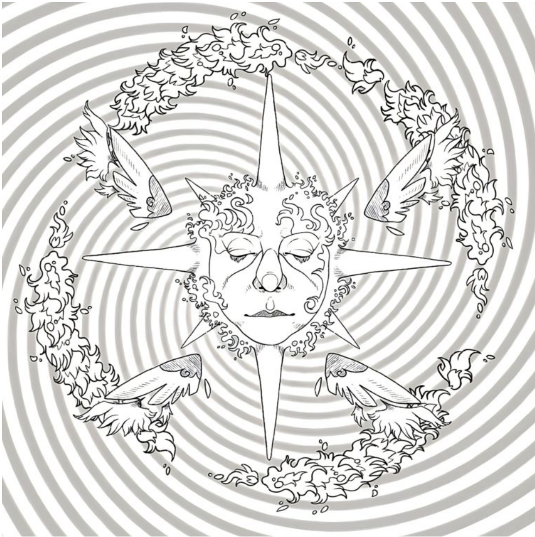
Mariasole Gnutti, Serafino, 2022, still da video