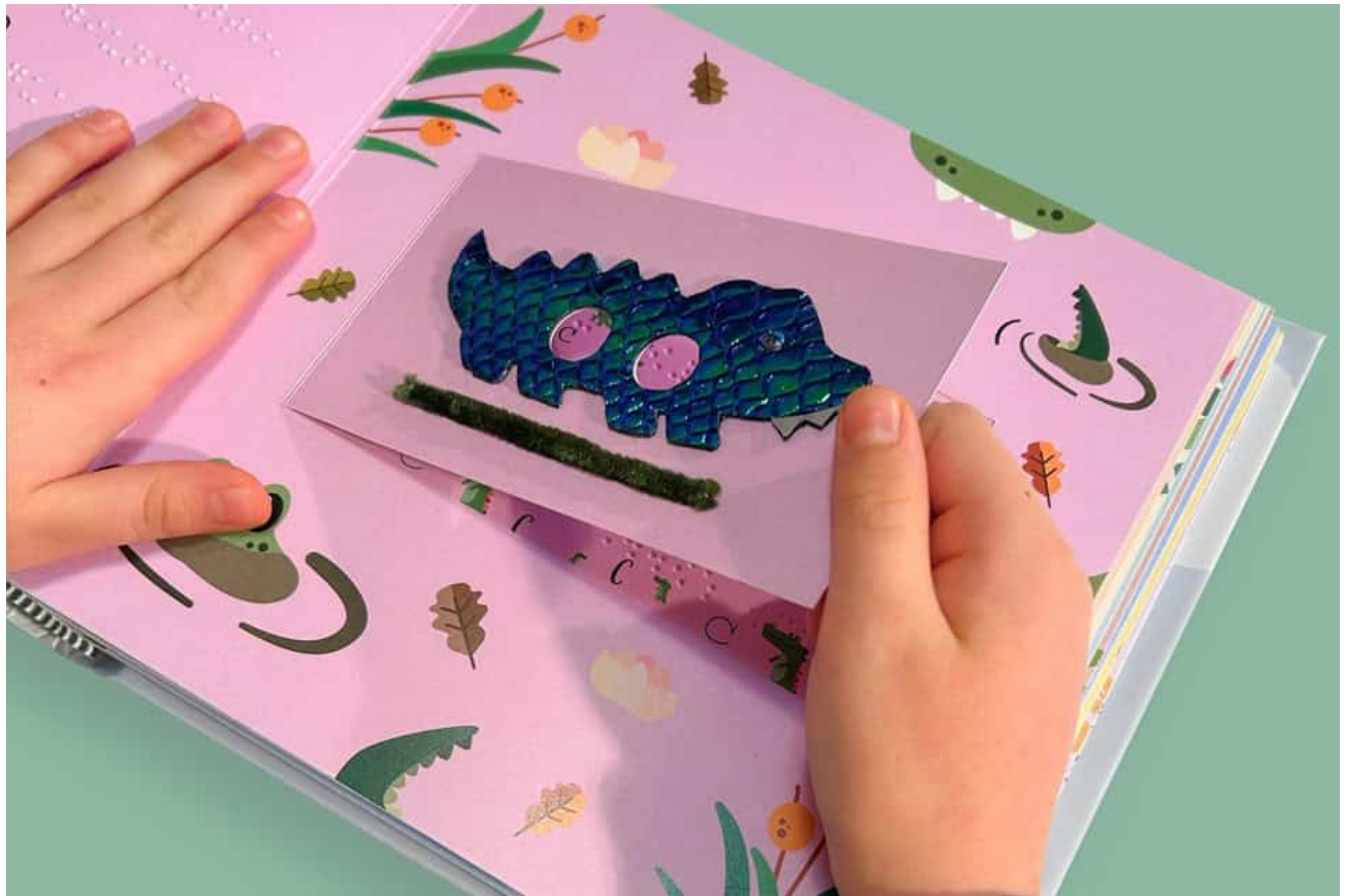
Il libro tattile realizzato da Silvia Baroni