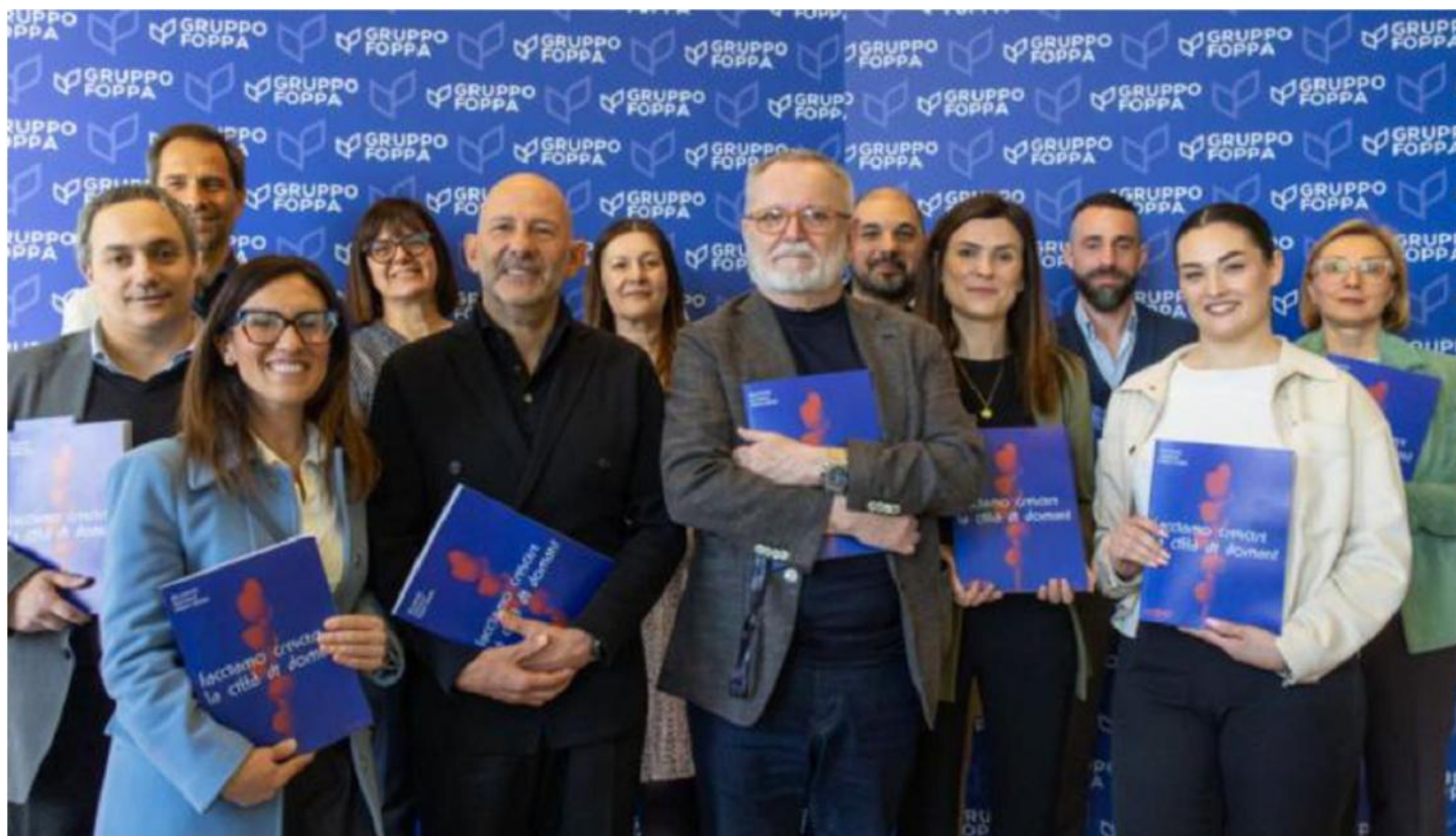
Gruppo Foppa Presentato dai vertici il Bilancio sociale 2024-2025 della realtà formativa bresciana che ha celebrato i 40 anni