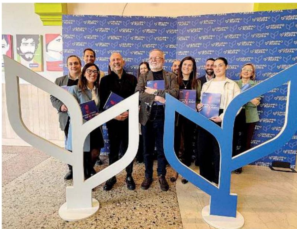
Insieme. Dirigenti delle varie anime del gruppo dietro al logo