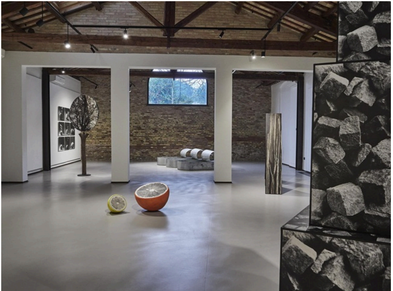
Veduta della mostra Immagini nello spazio di Nataly Maier, Fondazione Sabe per l'arte, ph. Daniele Casadio (1) copia