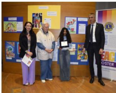
ZONA 21 Ameshi Kananhera 1B - Corte Franca