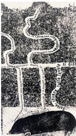
Un'opera in mostra