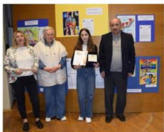
Darla Buka 3D - Capriolo