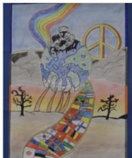
Il primo della Circostrizione 3