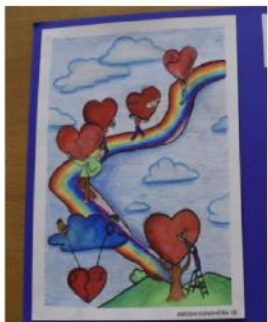
Il disegno vincitore per la zona 21