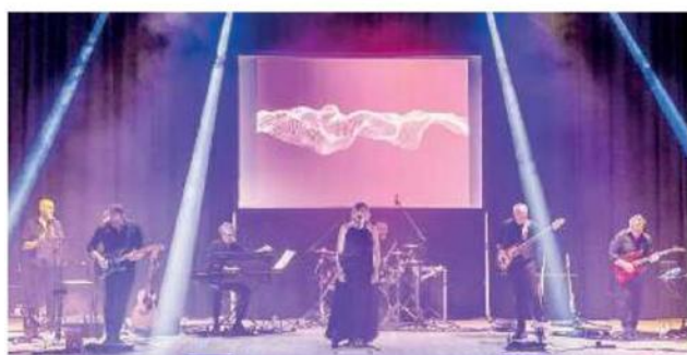
Sul palco. La Trait d'Union Band nello show «Raccontami una donna»