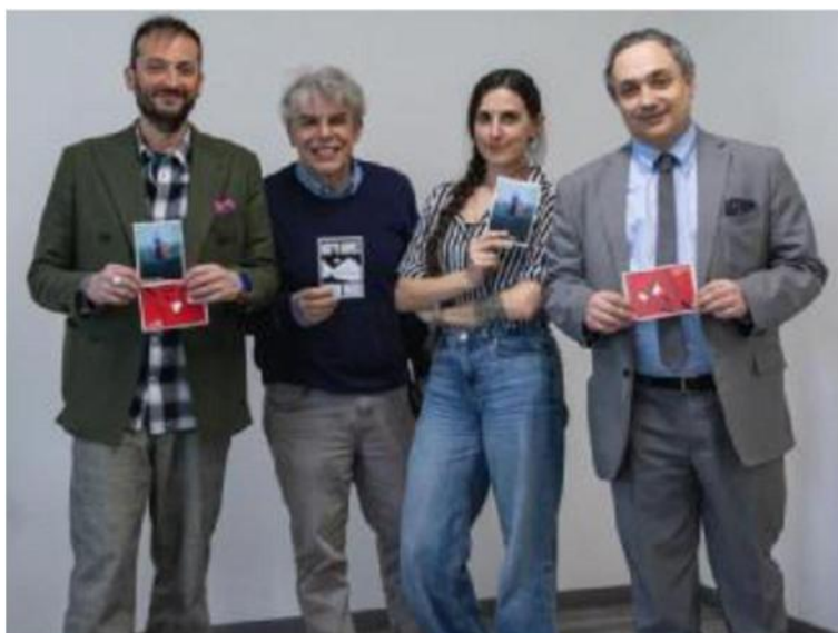
In Hdemia La presentazione del nuovo corso triennale