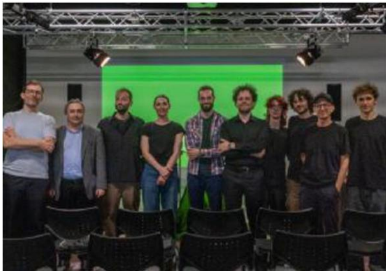
Protagonisti Terza edizione per l'evento «interdisciplinare»