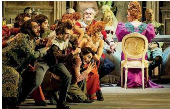
Colori. «Hamlet» di Ambroise Thomas