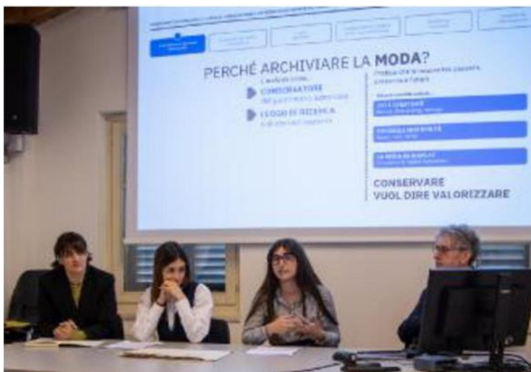
L'incontro Presentato anche un lavoro delle studentesse

Un patrimonio attivo, capace di generare valore, sostenere l'innovazione e guardare positivamente al futuro del made in Italy, all'interno del quale Brescia vuole restare protagonista. M.Laff.