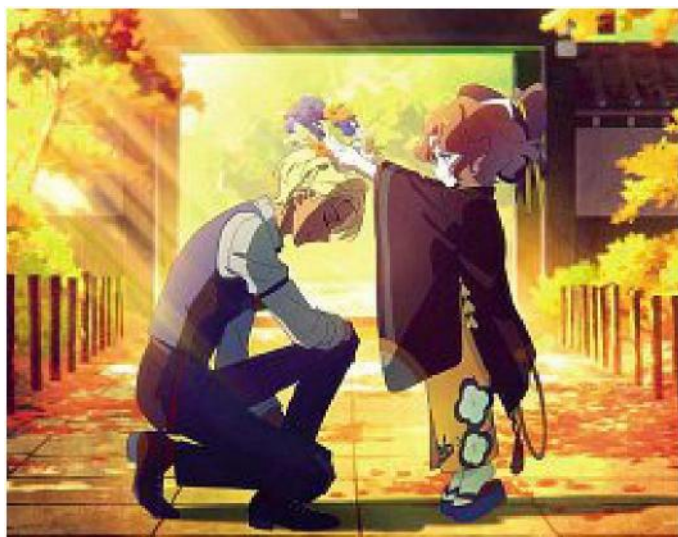
Fenomeno manga Una tavola del fumetto «Agent of the season»