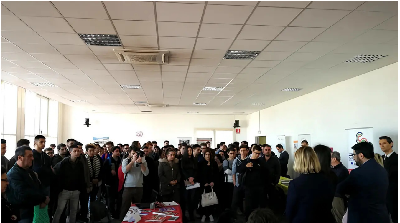
Presenti le principali università lombarde per unire formazione e lavoro