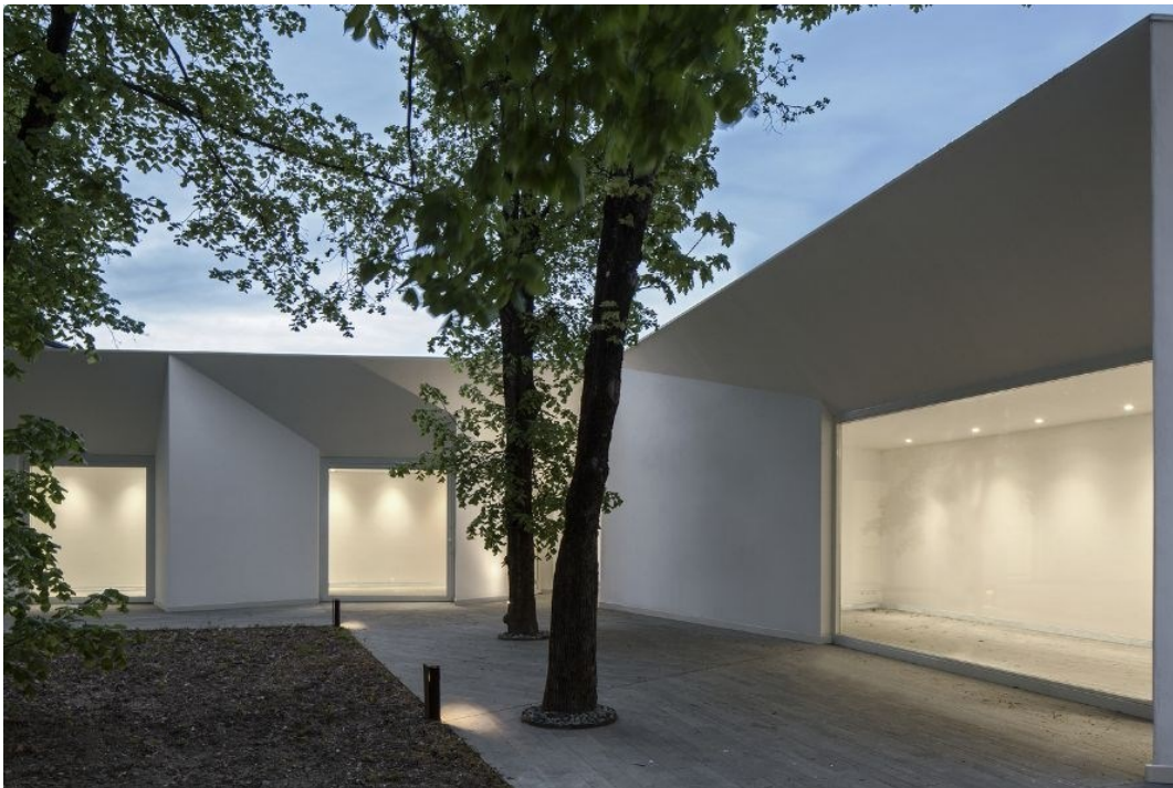
Sale civiche per il quartiere San Rocco (MC2 architetti, Borgo Val di Taro, Parma, 2018)

La Commissione Cultura dell'Ordine degli Architetti PPC di Brescia promuove, in collaborazione con la Fondazione dell'Ordine, un incontro di approfondimento dedicato al tema del progetto urbano come dispositivo relazionale. "Progetto urbano e architettura delle relazioni - Dario Costi dialoga con Giorgio Azzoni" propone il 6 maggio a partire dalle 18 un momento di riflessione teorica e operativa sui paradigmi contemporanei della progettazione architettonica e urbana.