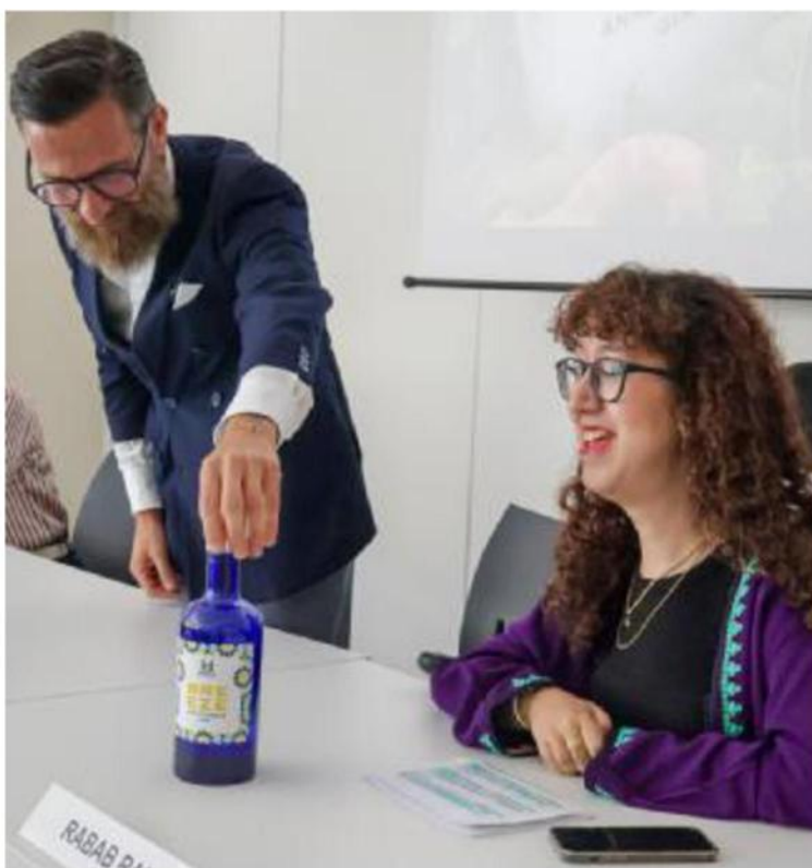
La studentessa vincitrice del contest