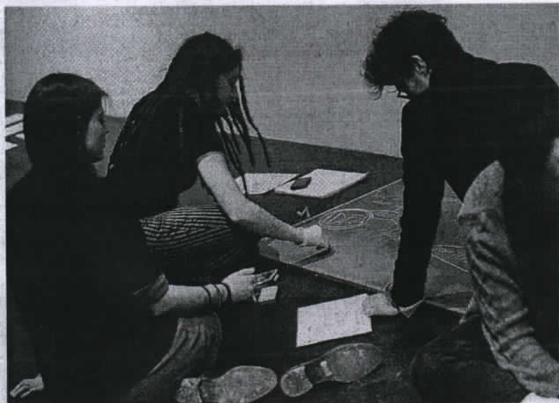
Creativi Studenti delle accademie Laba e Santa Giulia al lavoro negli spazi del Piccolo Miglio al Castello; sabato apre la mostra delle loro opere