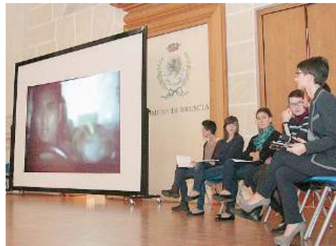
Un momento della presentazione di «Spot, si gira!»

Presentati i video su multiculturalità, dipendenze e rapporto uomo-donna